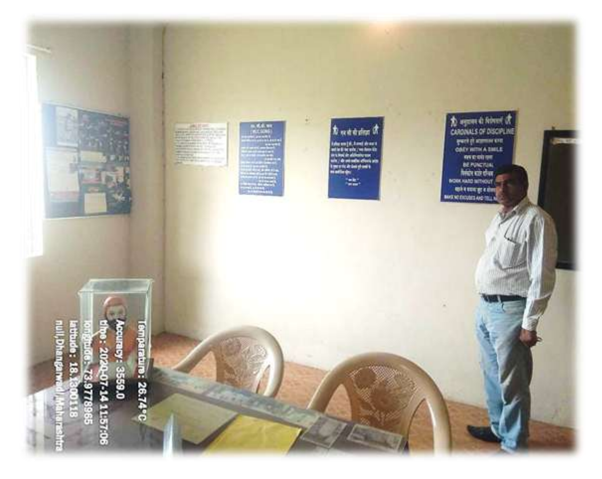
National Cadet Corps Office